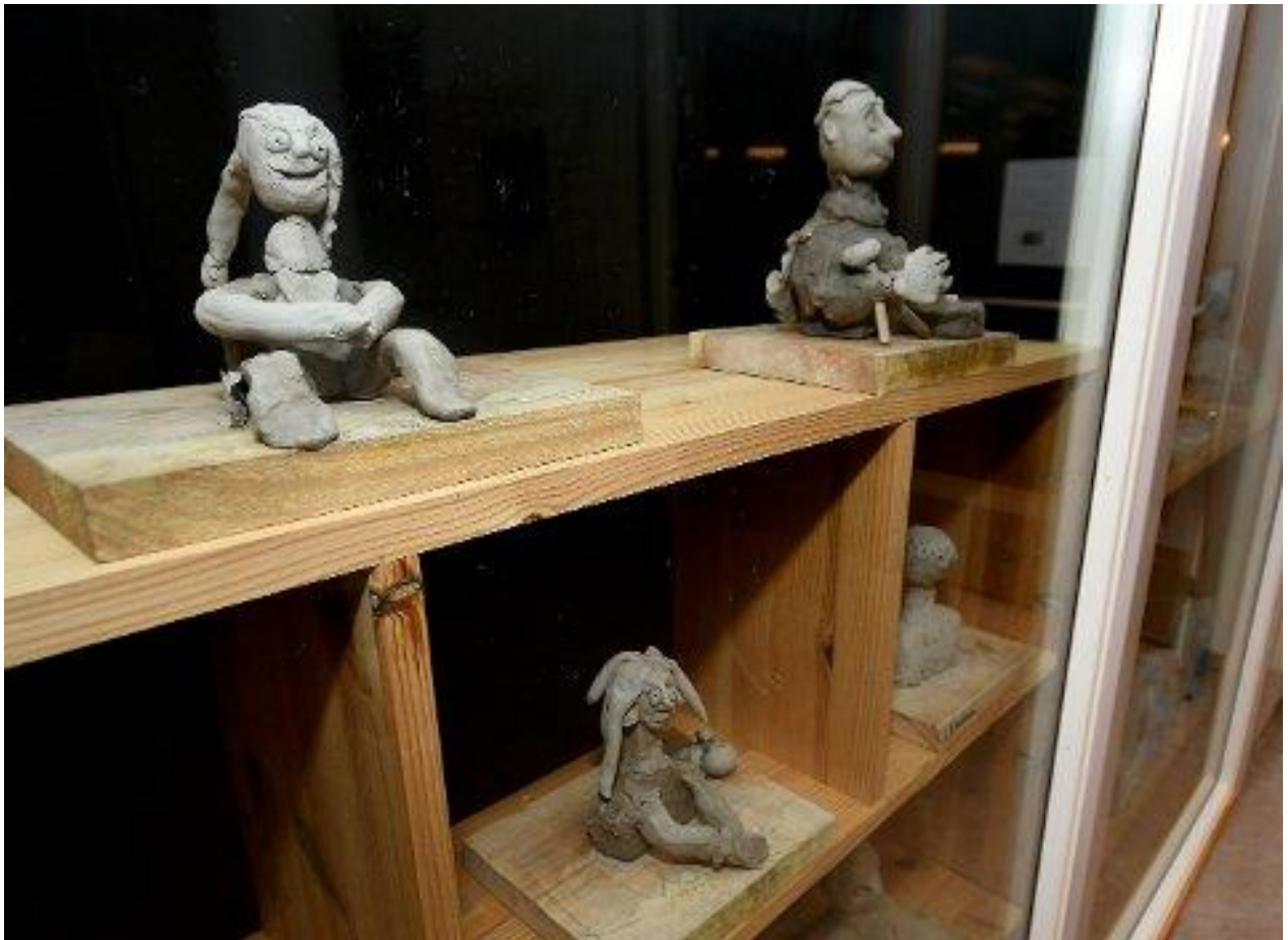
Skulpturar laga av elevane.