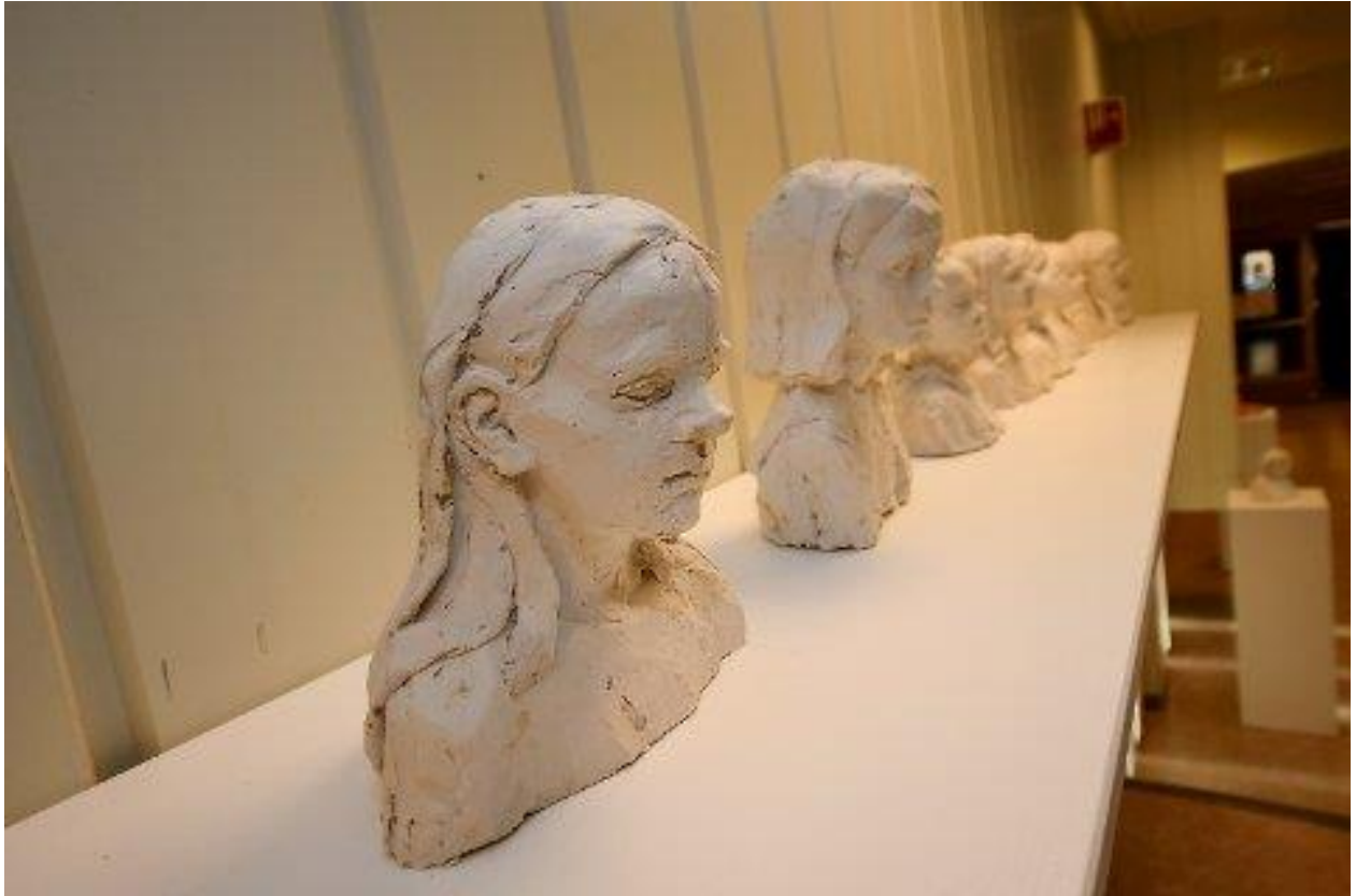
Harr har laga byster av elevane i "kunstklassa".

Han innrømmer at han var litt spent før han gjekk i gang med kunstprosjektet.