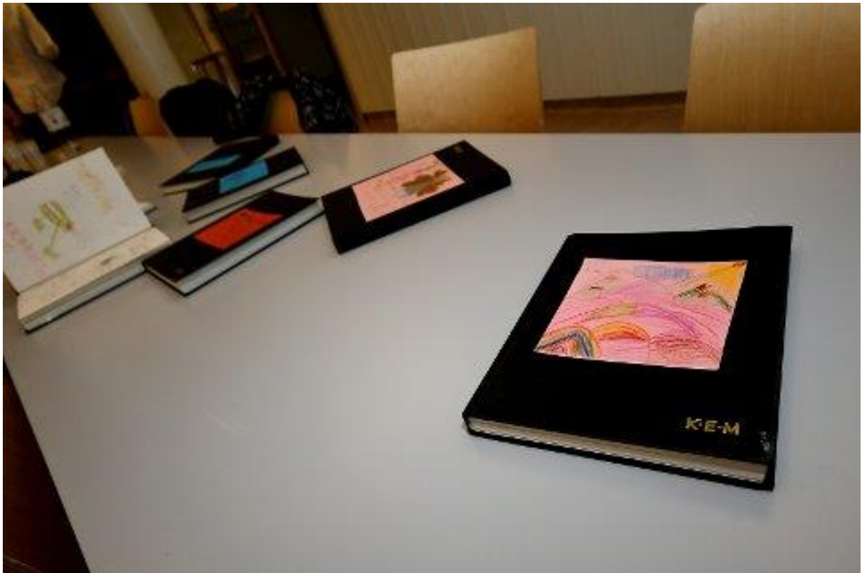
Elevane dokumenterar det dei arbeider med og lærer.