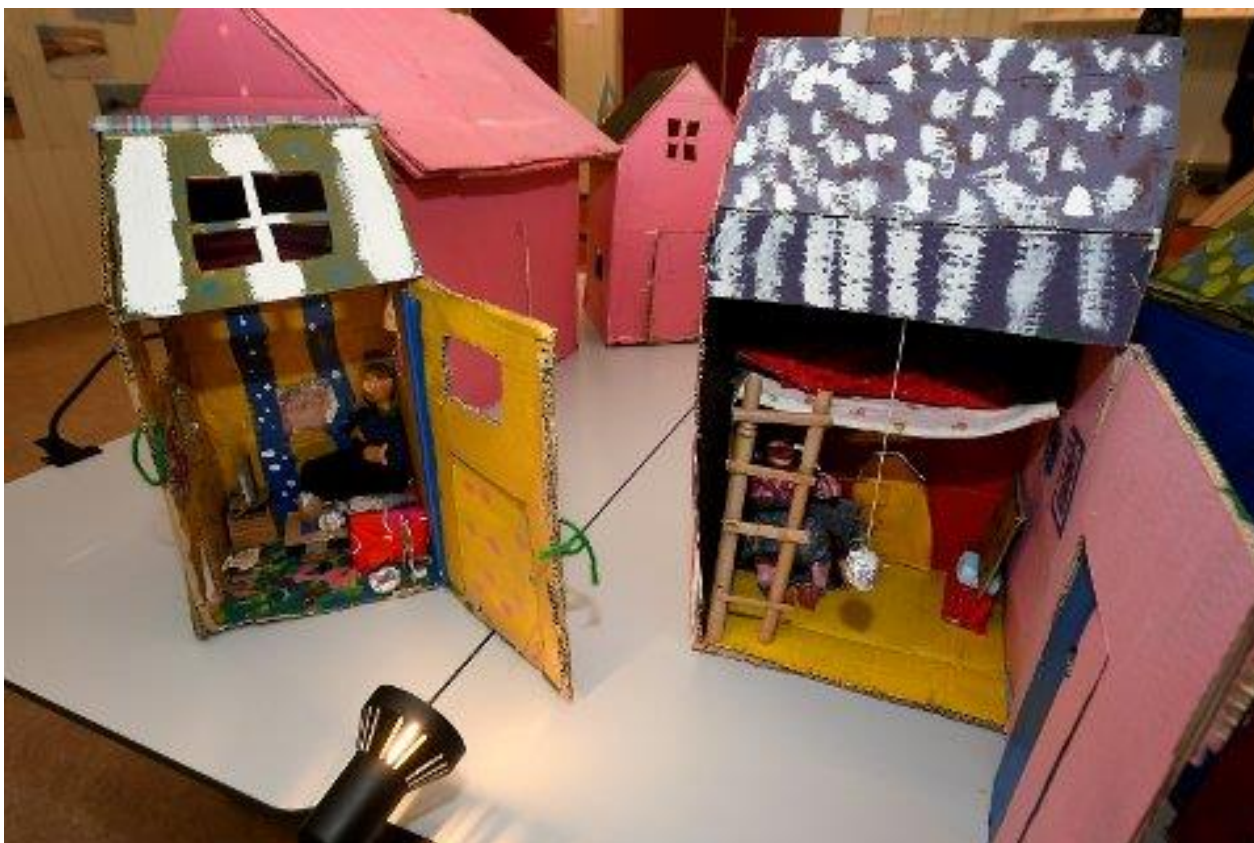
Det ligg mykje arbeid bak dei rørlege figurane og kulissane.

Elevane fekk i oppgåve å lage dokker av eit familiemedlem eller ein venn.